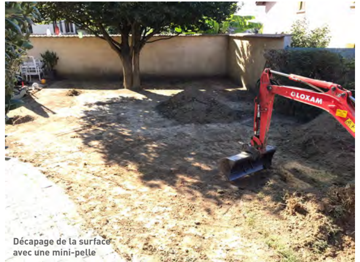
Décapage de la surface avec une mini-pelle