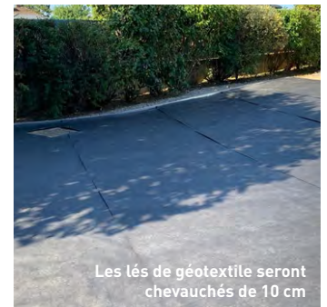
Les lés de géotextile seront chevauchés de 10 cm

Votre surface est enfin prête pour installer votre gazon synthétique !