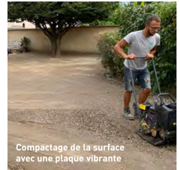
Compactage de la surface avec une plaque vibrante